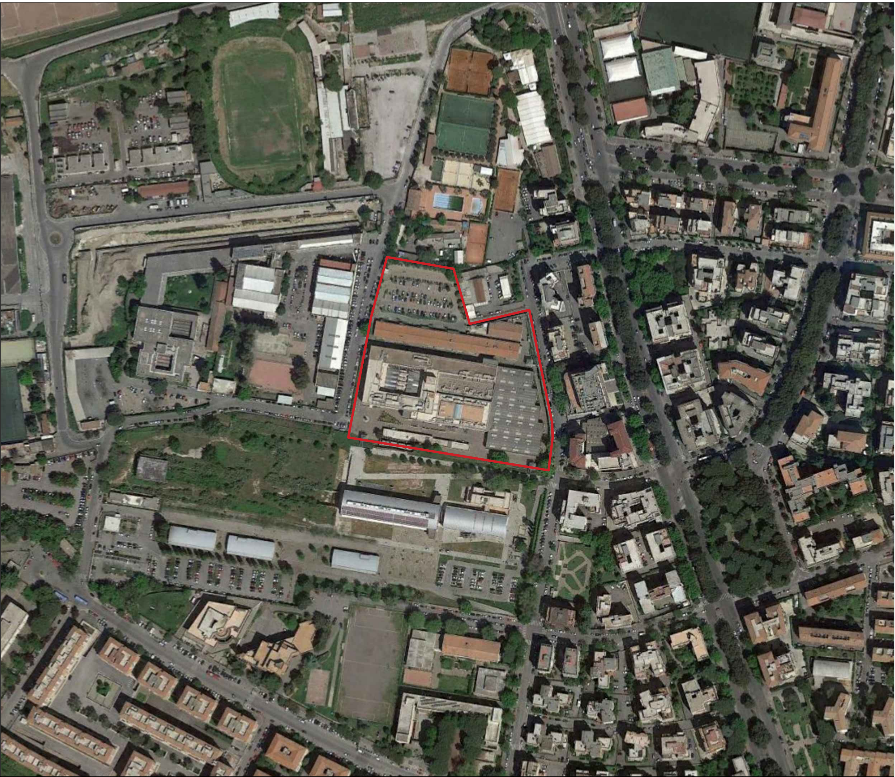
B1 ORTOFOTO 1:2000