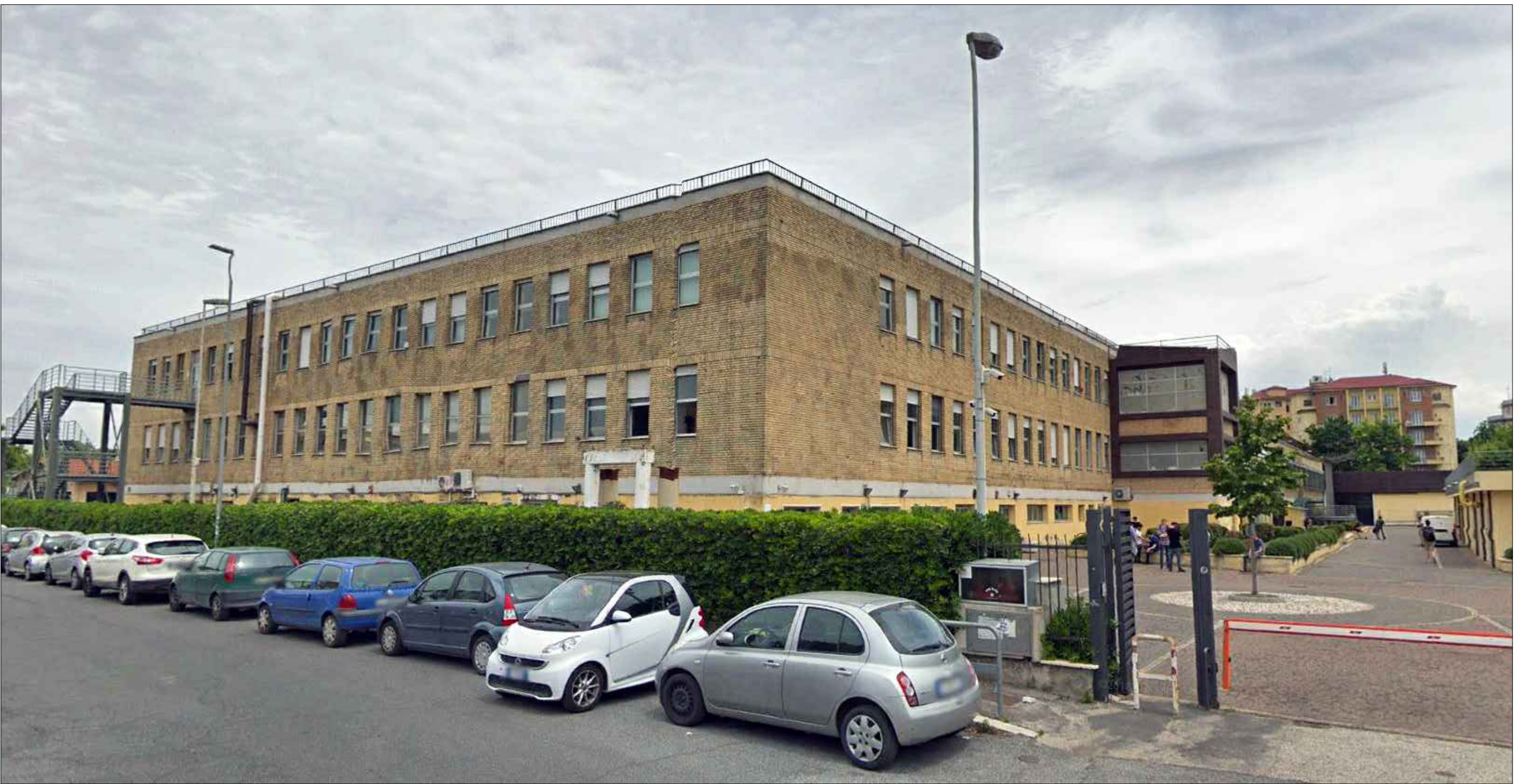
D1 DOCUMENTAZIONE FOTOGRAFICA NON IN SCALA